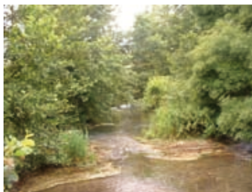
Ripisylve diversifiée avec arbres, arbustes et herbacées.

En partenariat avec l'Agence de l'Eau et les Conseils Régionaux, le Centre Régional de