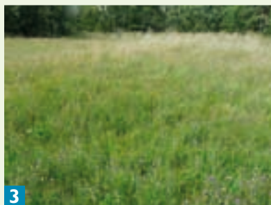
Une prairie de fauche entretenue pour les 2 ball traps annuels.