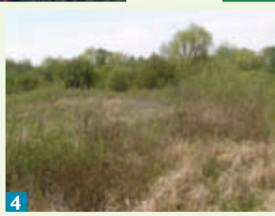
Des mégaphorbiaies présentant une grande richesse floristique.