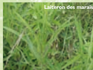
Laiteron des marais