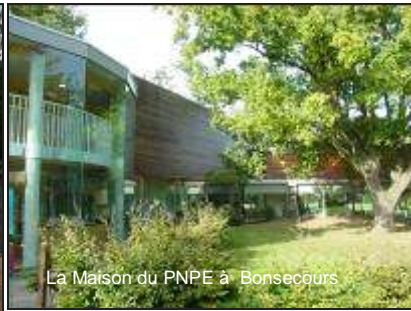
La Maison du PNPE à Bonsecours