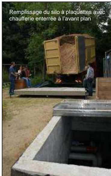
Remplissage du silo à plaquettes avec chaufferie enterrée à l'avant plan