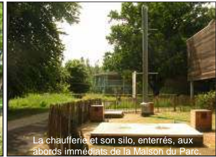
La chaufferie et son silo, enterrés, aux abords immédiats de la Maison du Parc.