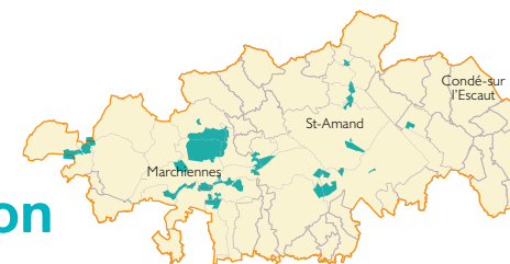
Parc naturel régional Scarpe-Escout ZSC

Une étude a été lancée en 2012 afin de faire un bilan de cette contractualisation et d'évaluer son effet sur la valeur écologique et agricole des prairies. Cette étude concerne trois agriculteurs et 6 parcelles sur les communes de Nivelles et Saint Amand. Des analyses seront conduites tous les deux ans sur les 5 années de la contractualisation afin de mesurer l'évolution de la qualité floristique, faunistique et fourragère des parcelles. Les conclusions de l'étude permettront, le cas échéant, d'adapter les cahiers des charges dans le cadre des nouveaux dispositifs de contractualisation.